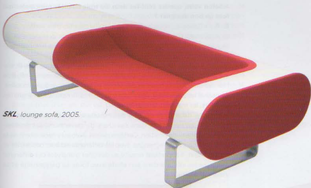
SKL , lounge sofa, 2005.