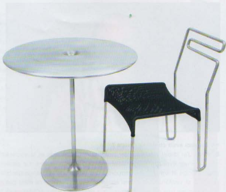
Carbongina , chaise en acier, 2004, et Spun , table en aluminium, 2005.