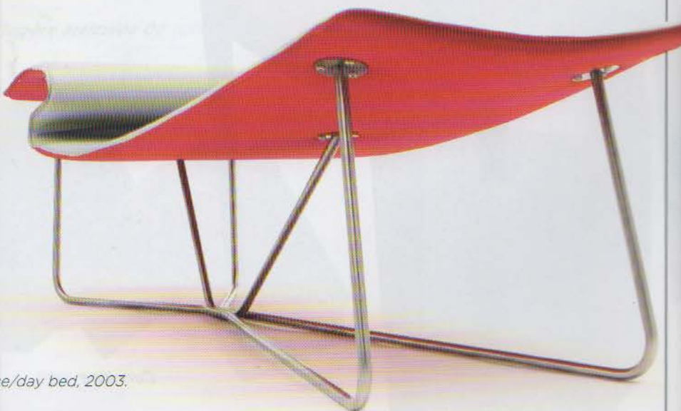
Essence , chaise longue/day bed, 2003.